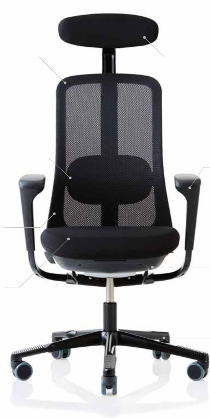
HÅG SoFi 7500 mit Netzrücken ↑

Die Auflageflächen des Fußkreuzes erlauben einen dynamischen Wechsel der Fußposition und stimulieren dadurch Blutfluss und Bewegung.