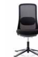
HÅG SoFi 7202 mit schwarzem Netzbezug*