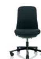
HÅG SoFi 7302 mit gepolsterter Lehne*