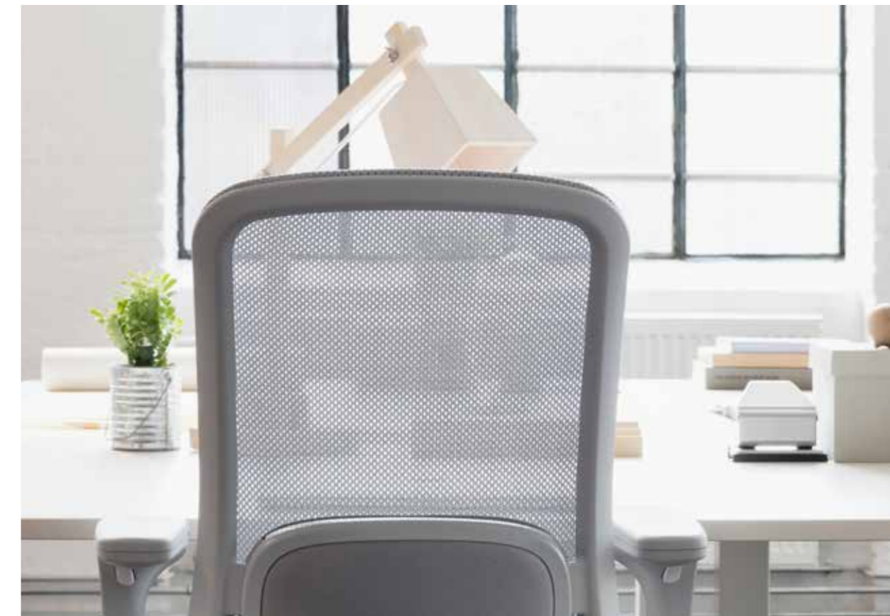
HÅG SoFi mesh in MEH002 Mesh hellgrau mit Stoffbezug Nexus Pewter 01 von Camira