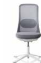
HÅG SoFi 7502 mit hellgrauem Netzbezug*