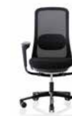
HÅG SoFi 7500 mit schwarzem Netzbezug**