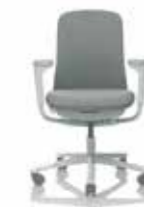
HÅG SoFi 7200 mit gepolsterter Lehne**