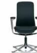
HÅG SoFi 7302 mit Stoff Polerat Exclusive*