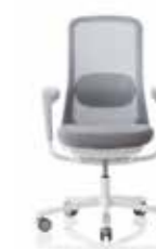
HÅG SoFi 7500 mit hellgrauem Netzbezug**