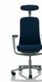
HÅG SoFi 7300 mit gepolsterter Lehne und Kopfstütze